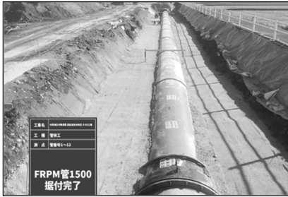
新岩倉用水地区 その8工事