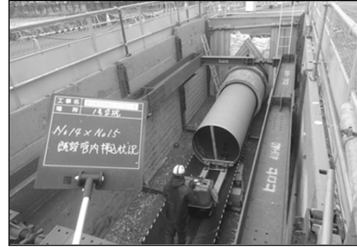
新岩倉用水地区 その10工事