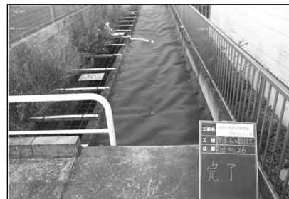
木津用水路堤塘整備草刈その2工事