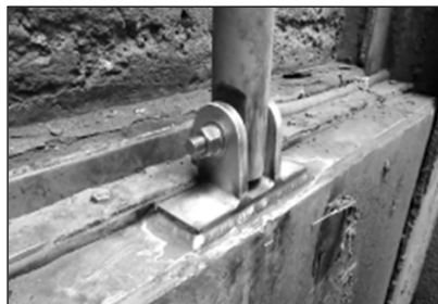
単独土地改良事業 加納分水工放流ゲート補修工事